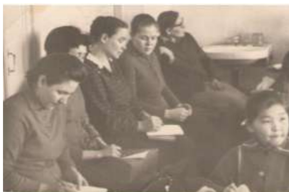
Открытый урок в школе № 35,