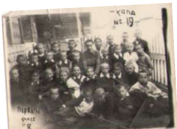
1955 год, 1 класс, школа № 19