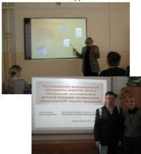
Участие в школьном этапе конференции «Шаг в будущее», 2010 год