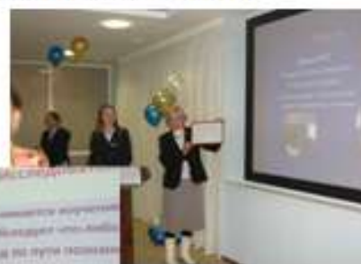
Фестиваль финансовой грамотности 3 место в республике, 2009 год